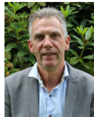
V.A.M. Hulshof Bestuurslid